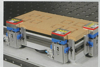
上クランプ付昇降定規 OP. 数量選択